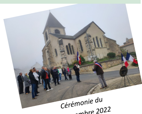
Cérémonie du 11 novembre 2022

Retrouvez toutes les alertes et actualités sur L'appli PANNEAUPOCKET